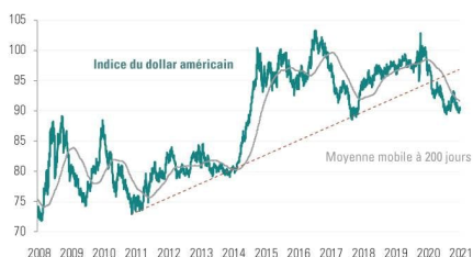
L'ÉVOLUTION DE L'INDICE DU DOLLAR AMÉRICAIN DEPUIS 2008

Valeur du dollar vis-à-vis d'un panier de grandes devis mondiales